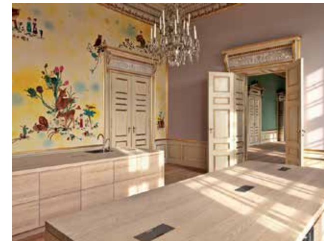
Expo A modern royal household

Mikael Colville-Andersen, photographe et expert en mobilité urbaine, a réalisé pendant 4 ans une série de superbes photos de copenhagois à vélo. Plus de 55 % des habitants de la capitale danoise enfourchent chaque jour leur vélo pour se rendre au travail, à l'école ou à l'université, même ceux qui habitent, travaillent ou étudient en dehors de la ville. À Copenhague, les cyclistes parcourent chaque jour 1,2 million de kilomètres, soit deux fois l'aller-retour entre la Terre et la lune. En plus, Allan Leenen inspirera les bruxellois avec quelques vélos revisités version tendance qui seront exposés dans les différentes salles du festival.