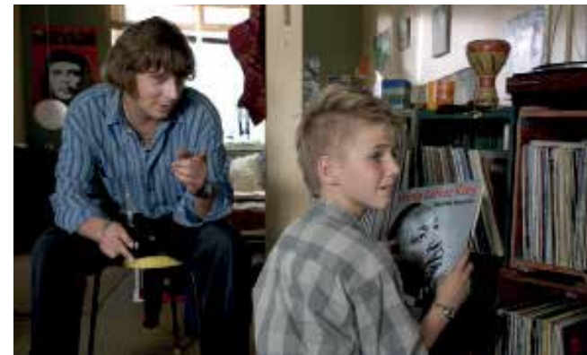
We shall overcome