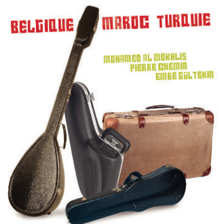
Un CD pour commémorer l'immigration marocaine et turque en Belgique

Concert de présentation du CD le 23 mars 2014 à 20 h à l'Espace Senghor – Etterbeek.